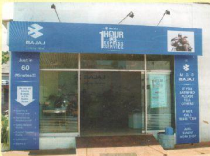
1st సెప్టెంబర్ 2007 నుండి బజాజ్ డివిజన్ వారు ప్రారంభించిన (60 నిమిషాల్లో 48 పరిష్కలు) 1 Hour Express Service Capsule.