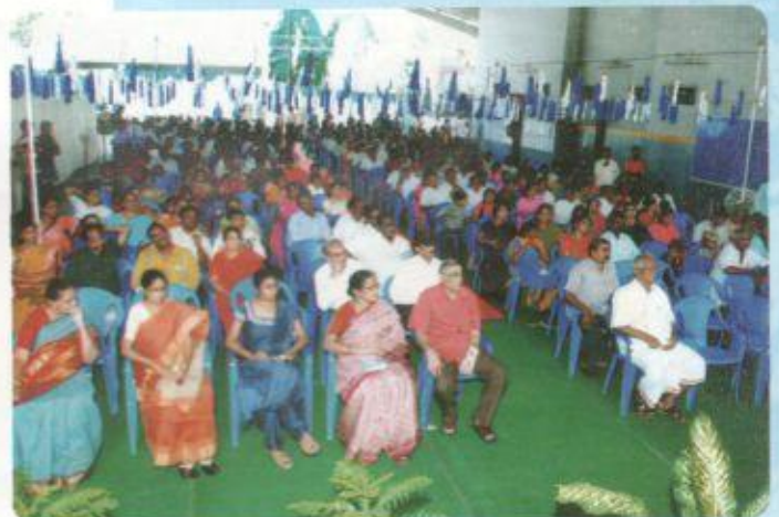
23-09-07 నెల్లూరు రియల్ ఎస్టేట్ సుందర నగర్ వెంచర్స్ లక్సీ డ్రా సందర్భముగా జరిగిన సభకు విచ్చేసిన సభ్యులు