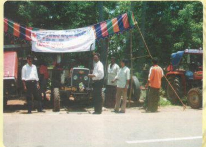
28-8-2007 నాడు టాప్ డివిజన్ నెల్లూరు వారు ఆమంచర్ల యందు నిర్వహించిన సర్వీసు క్యాంపు దృశ్యం.