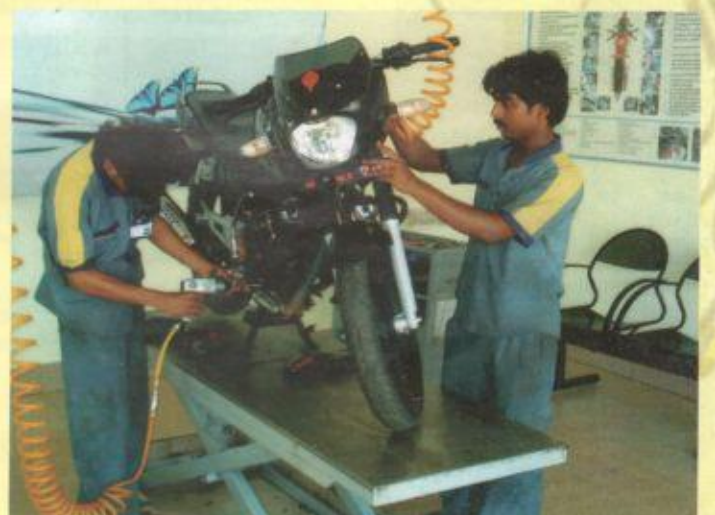
Express Service Capsule.నందు వాహన పరిక్షలు చేస్తూన్న మెకానిక్స్.