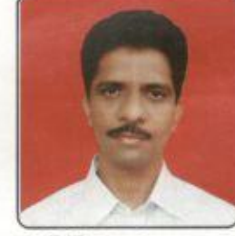
MR. SK. కలిముల్లా PCDWS