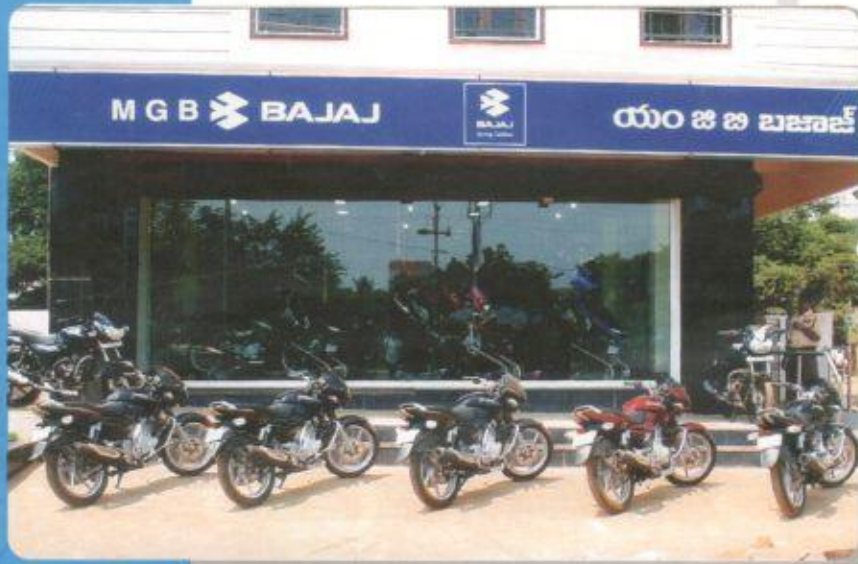
మిని వైఫాస్ లో ముక్తుకూరు జంక్షన్ వద్ద సూతనంగా ప్రారంభించిన బజాజ్ హబ్