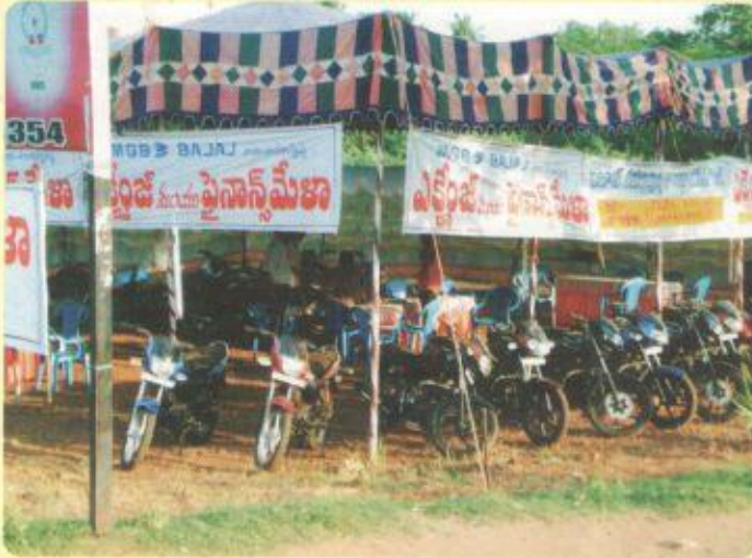
ఆగస్టు 13,14 తేదీలలో బజాజ్ డివిజన్ వారు నెల్లూరు కస్తూర్బా దేవి స్కూలు ఎదురుగా నిర్వహించిన సర్వీసు క్యాంపు.